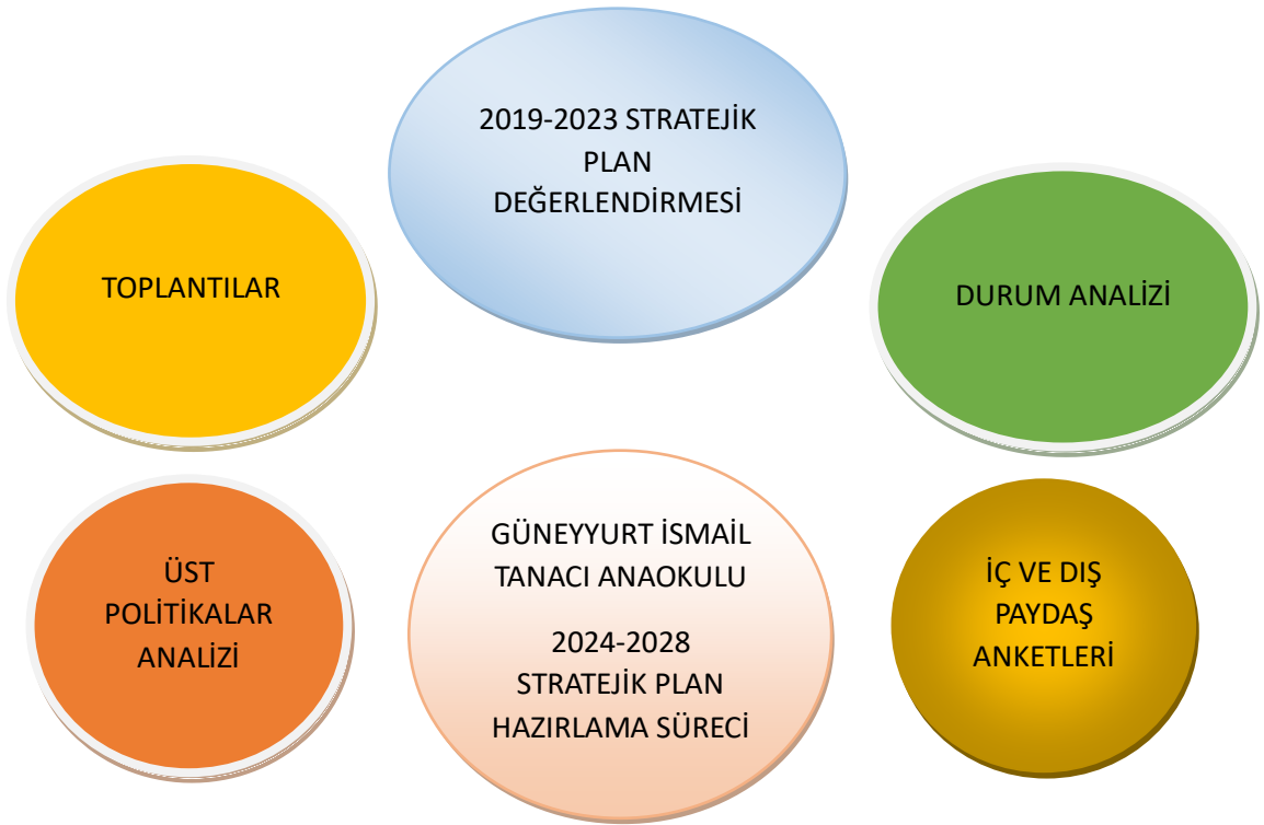
Şekil 1: Stratejik Plan Oluşum Süreci

Durum analizi tamamlandıktan sonra, geleceğe yönelik stratejiler belirlemek adına çalışmalar yapılmış ve okulumuzun amaçları, hedefleri, göstergeleri ve bu doğrultuda yapılacak eylemler belirlenmiştir. Bu süreci yürüten ekip ve kurul üyelerinin bilgileri aşağıda sunulmuştur